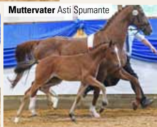
Muttervater Asti Spumante