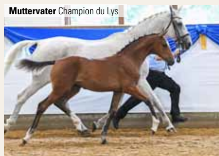
Muttervater Champion du Lys

FOHLENSCHAU 2021: 1. Jahrgang von Van Cordoba überzeugt auf ganzer Linie